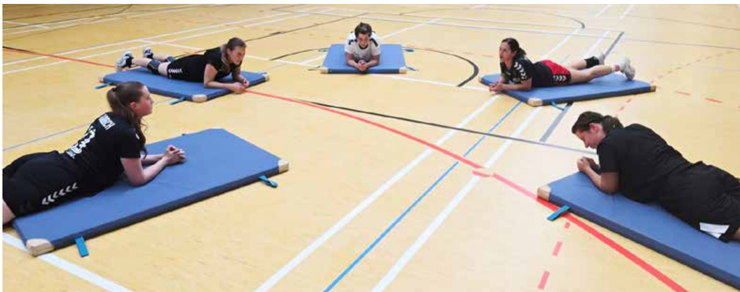
Training bei den 1. Damen immer Montag und Mittwoch ab 19:15 Uhr in der Werner Jaeger Halle.