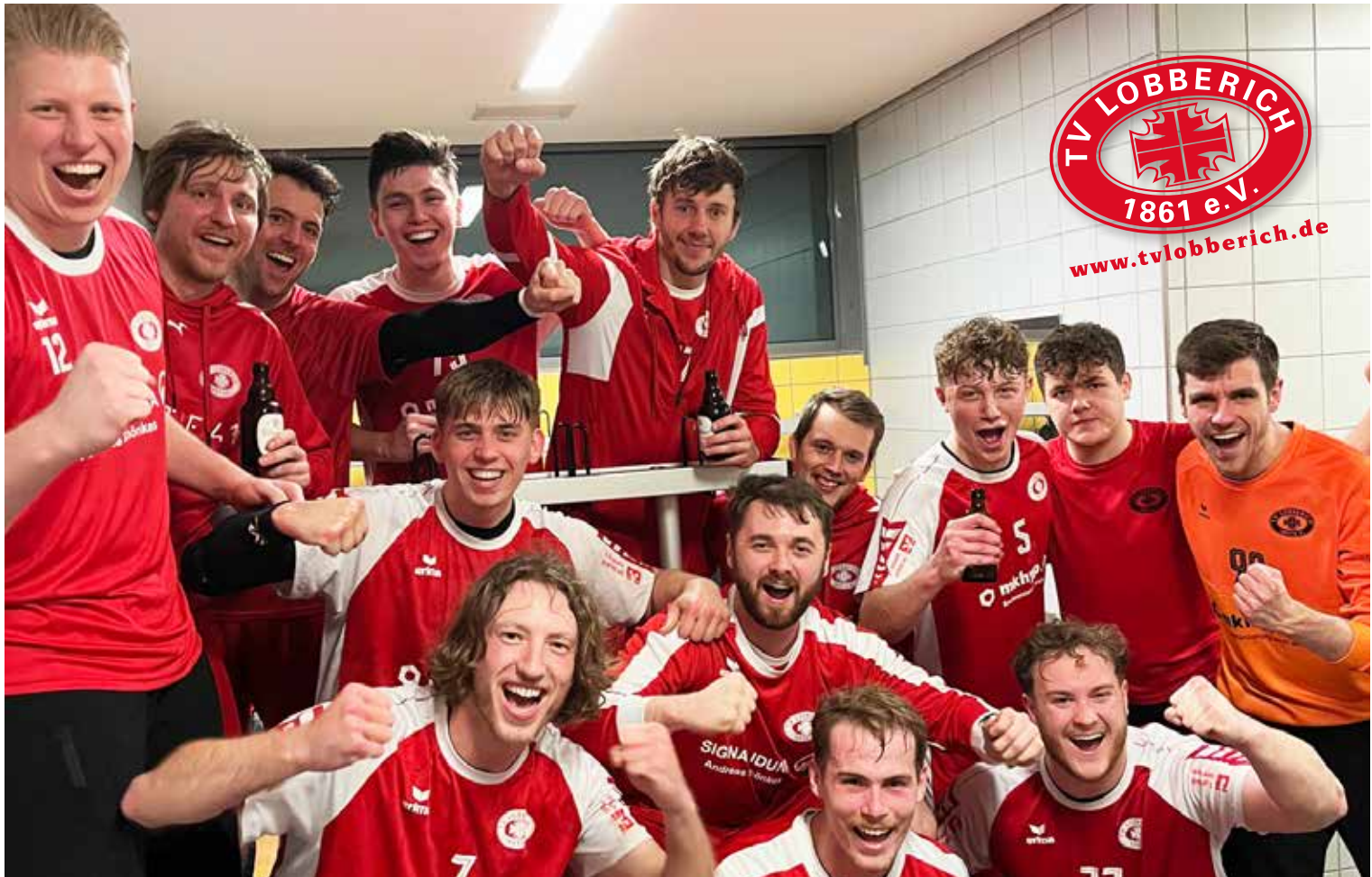
Jubel bei den 1. Herren über den 4. Platz in der Oberliga