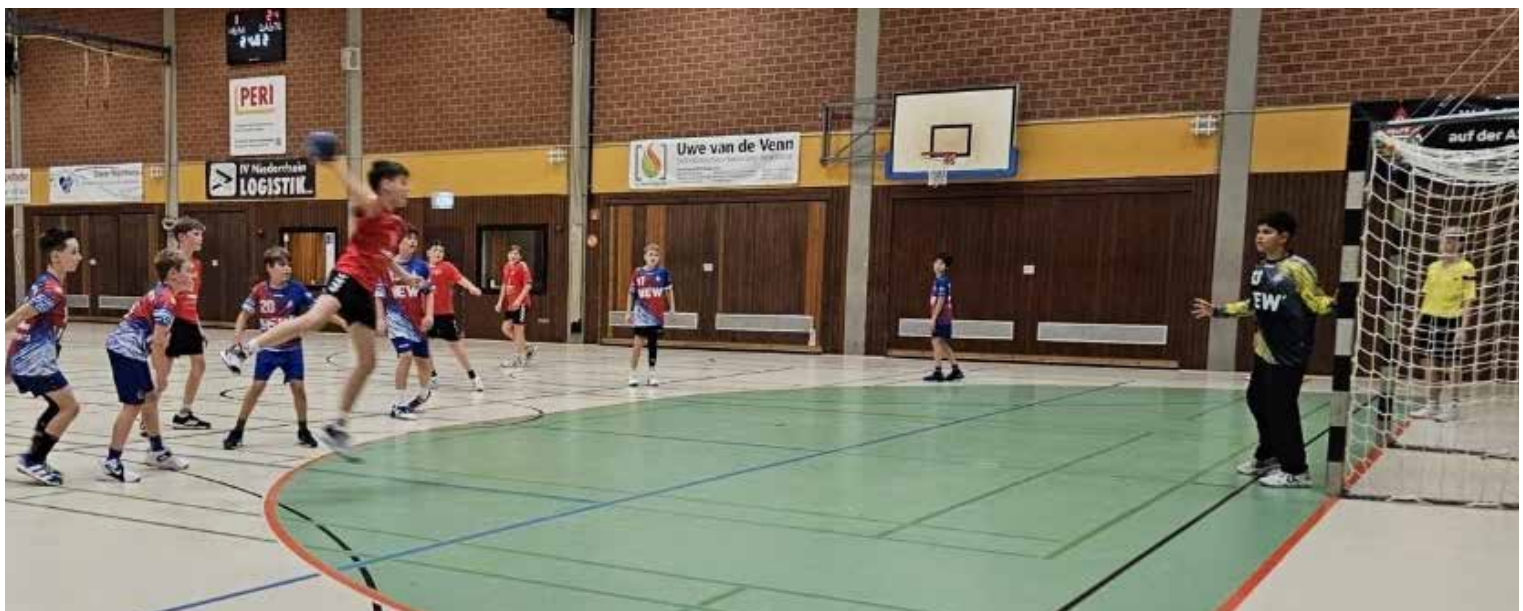
Spieldzene der männlichen D - Jugend