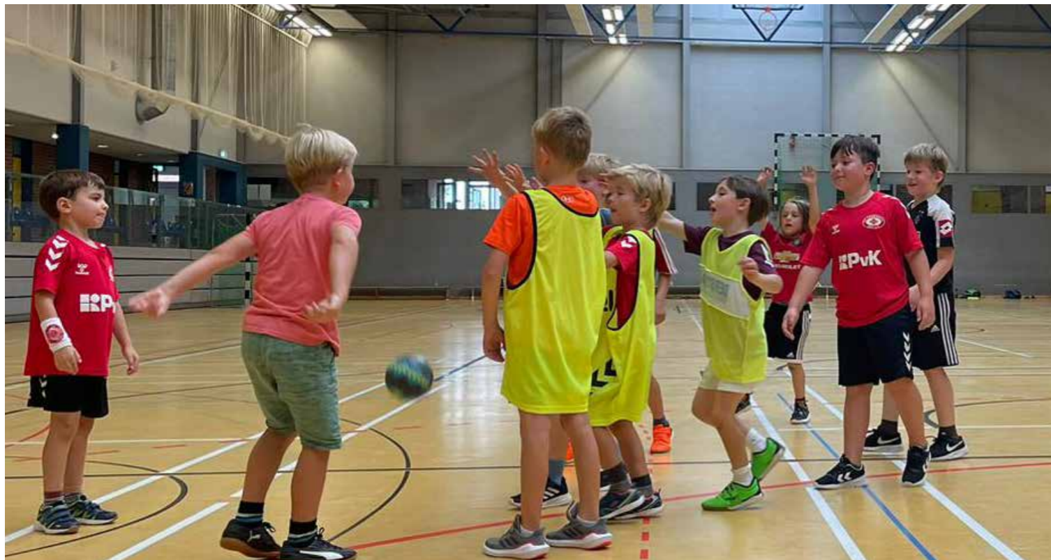
Die männliche F-Jugend beim Training