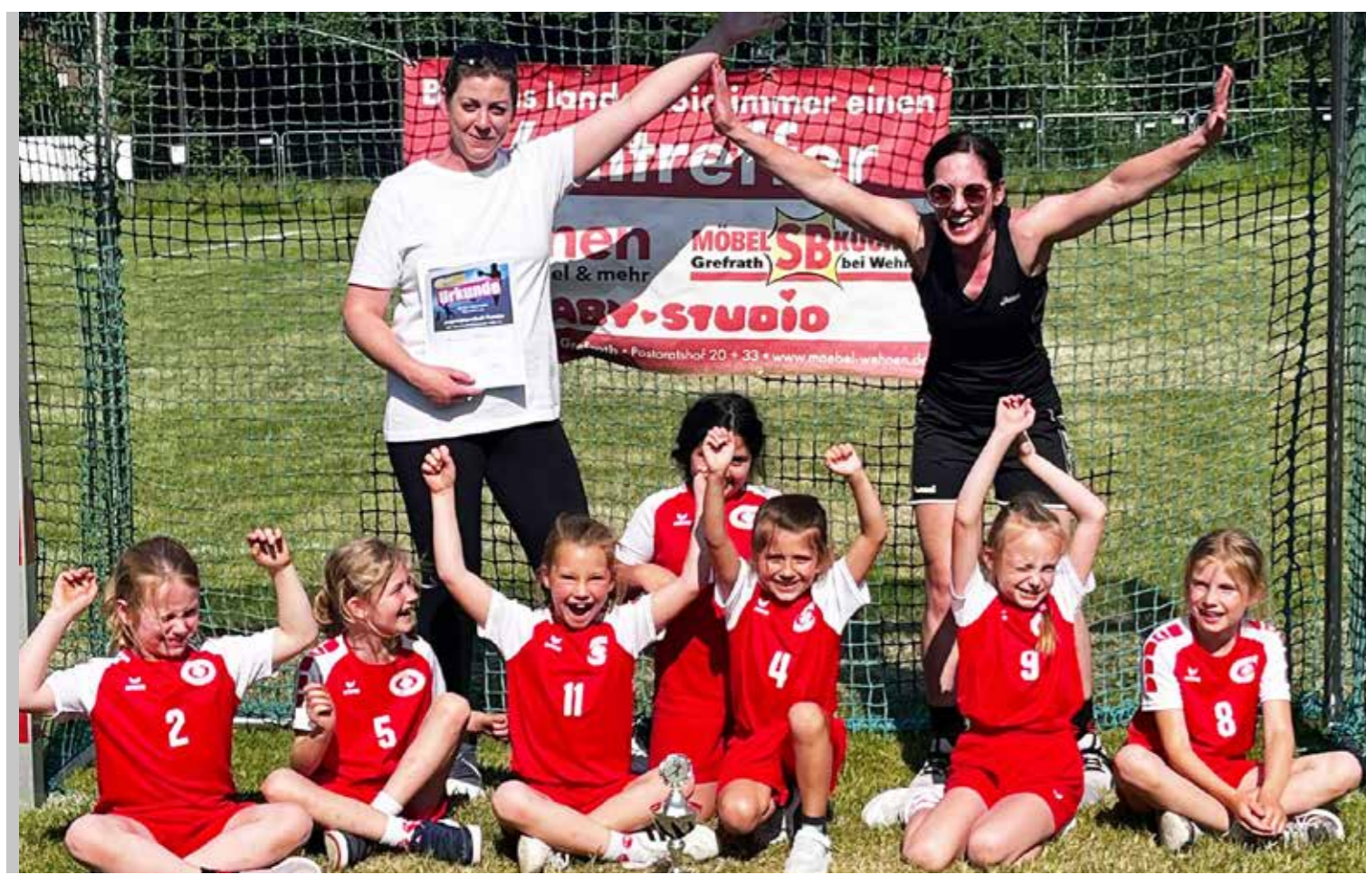
Jubel bei der weiblichen F-Jugend