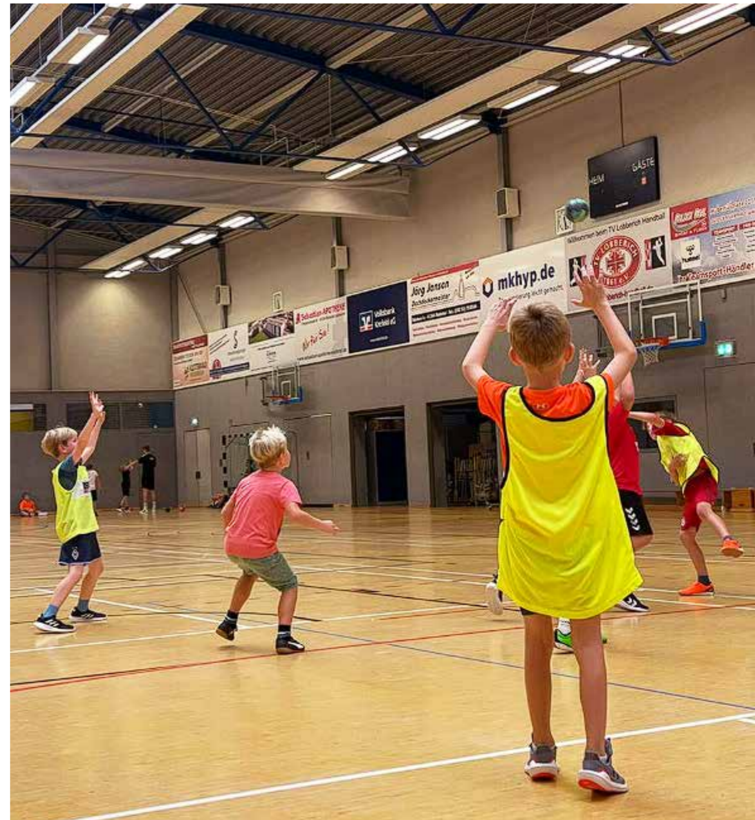
Die männliche F-Jugend beim Training