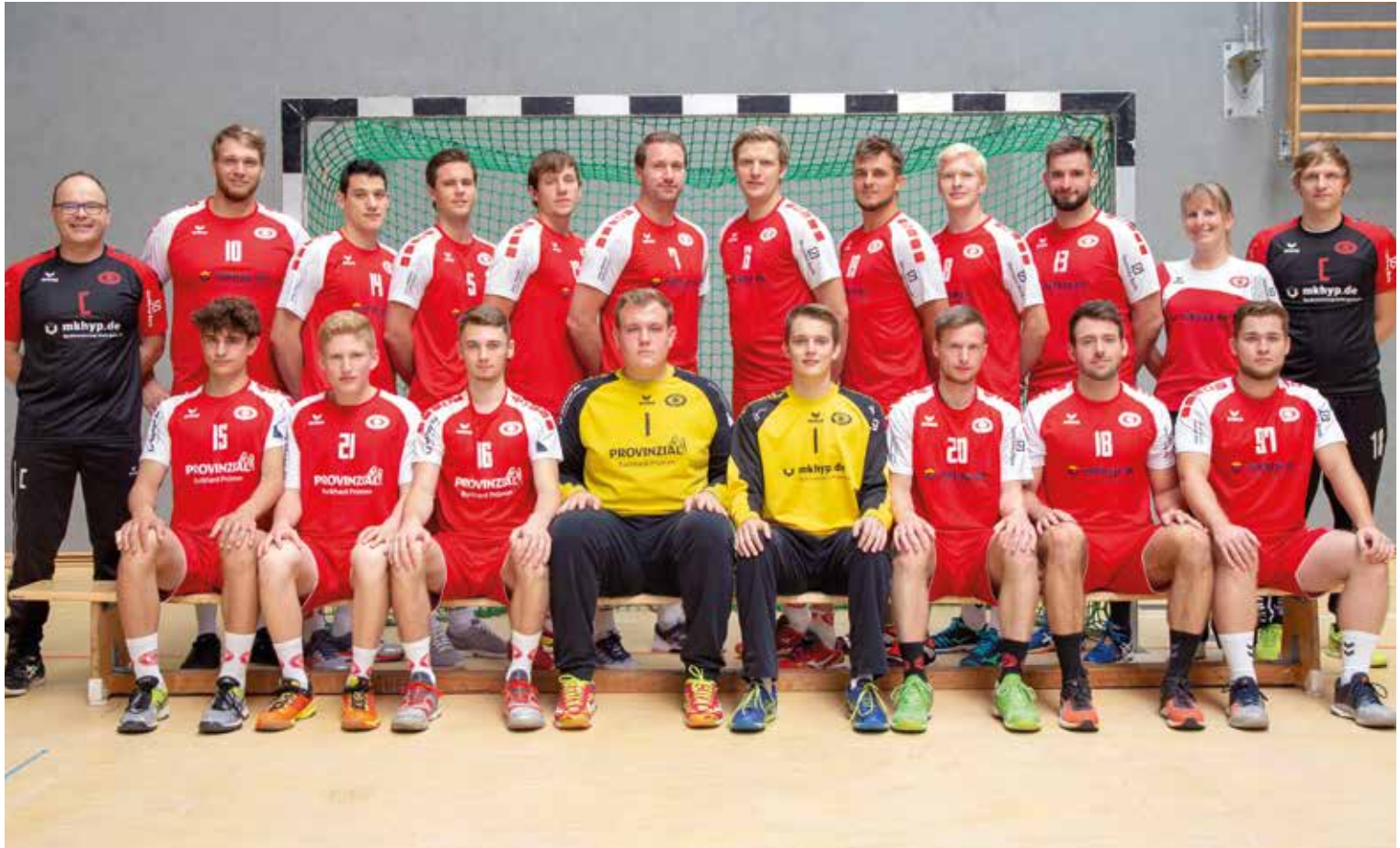
Die 1. Herrenmannschaft der Handballabteilung des TV Lobberich 1861 e.V.