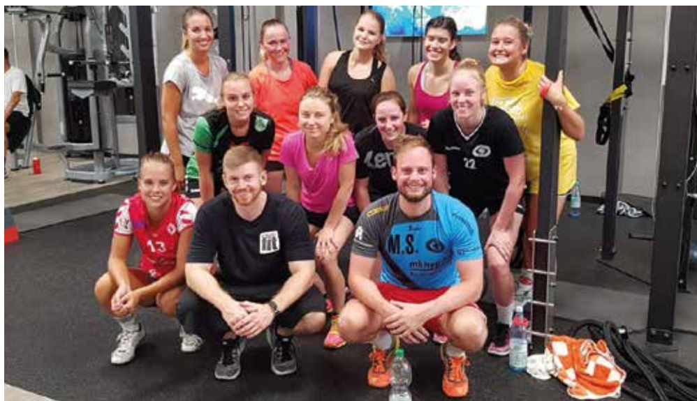
Nach einer Trainingseinheit im Cleverfit

Für die neue Saison heißt es nun voll angreifen und vor allem konstant spielen. „Wir wollen unseren Gegnern das Leben so schwer wie möglich machen und unsere Leistung bestätigen. Ein konkretes