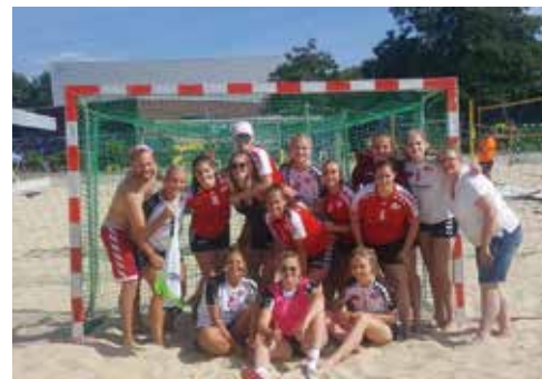
Beachhandball gehörte auch zur Vorbereitung

Pause geben, der lag falsch. In den zwei Wochen, wo Trainer Marcel Schatten „Sommerferien“ auf dem Trainingsplan eingetragen hatte, bekamen alle Spielerinnen die Aufgabe, selbstständig laufen zu gehen und die Ergebnisse immer zu dokumentieren. Nach den zwei Wochen startete die Mannschaft dann mit einer Boxeinheit im Band-Camp Uerdingen in den zweiten Teil der Vorbereitung. Eine einfache Trainingseinheit gab es nicht mehr, immer stand vorher Laufen oder nachher Krafttraining auf dem Programm. Doch bevor es wieder in die Halle ging, mussten die Mädels bei mindestens 35°C draußen in der Sonne Intervallläufe machen und anschließend noch zum TRX-Training bei Cleverfit. Jede Woche standen mindestens drei Trainingseinheiten, manchmal sogar noch ein Spiel auf dem Programm. Gegen die SG Überraehr und den 1. FC Köln wurden zwei Siege eingefahren, bei einem Dreierturnier in Köln gegen zwei höherklassige Mannschaften wurden dann die ersten zwei Niederlagen kassiert. Den letzten Feinschliff holten sich die Mädels dann im Trainingslager. Nach einer