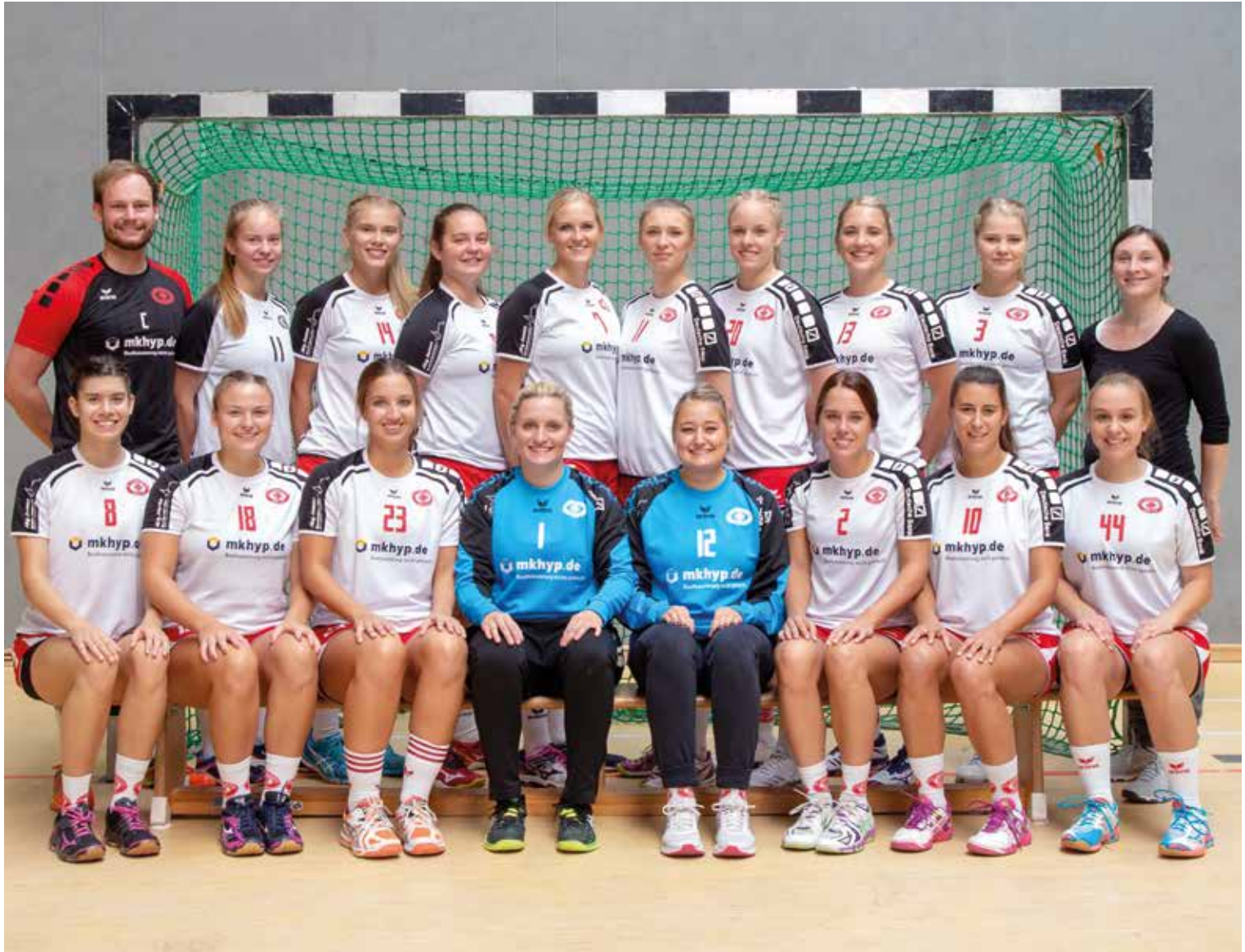
Das ist die neuformierte 1. Damenhandballmannschaft des TV Lobberich für die Oberligasaison 2018 / 2019

Wir freuen uns sehr auf die neue Saison und hoffen auf zahlreiche Unterstützung von unseren Zuschauern! Eure I. Damen