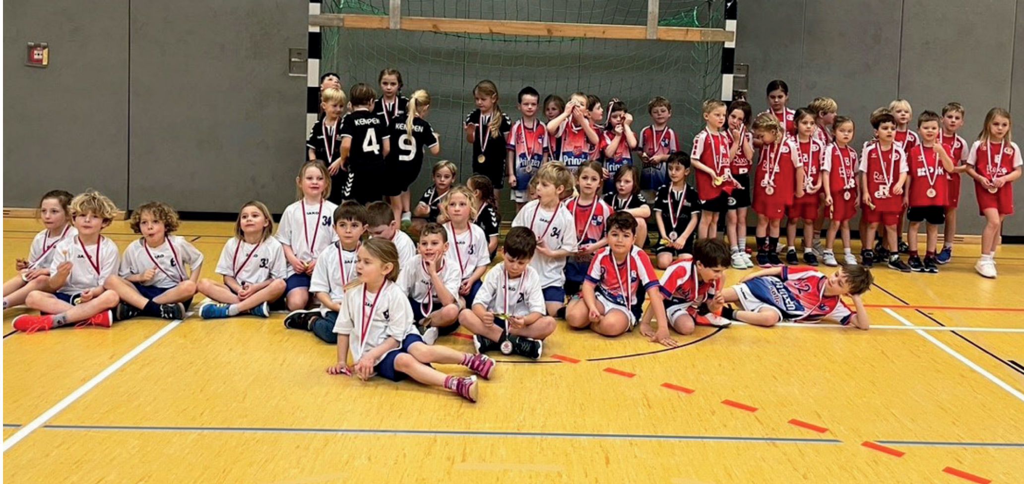
Die Minis präsentieren stolz ihre Medaillen!