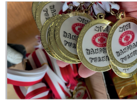
Medaillen für alle Minis!

In der Cafeteria wurde durch Unterstützung der Eltern für das leibliche Wohl gesorgt. Zum Schluss gab es wie immer die Siegerehrung, bei der es natürlich nur Sieger gab. Mit einer