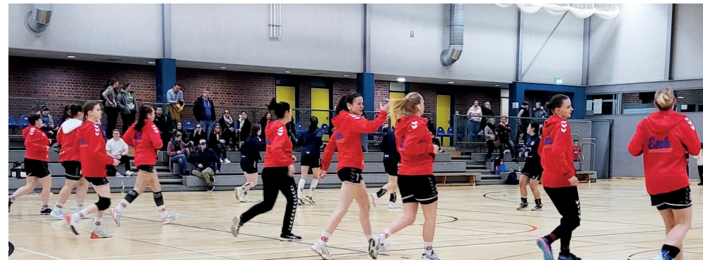
Aufwärmen vor dem Spiel!

Also noch eine Sorge mehr hinsichtlich des sehr kleinen Kaders. Das sollte allerdings