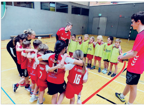
Begrüßung bei den Minis

Los ging es mit der Begrüßung aller Mannschaften morgens um 10.15 Uhr. In den nachfolgenden drei Stunden wurden insgesamt 10 Spiele von jeweils 12 Minuten ausgeführt, in denen die Kinder stolz in ihren Vereinstrikots alles gaben. Vor jedem Spiel begrüßten die kleinen Spieler sich und den Schiedsrichter