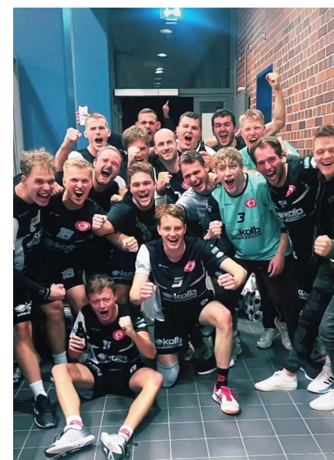
Vorfreude auf die Landesliga!