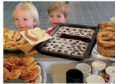
.... und beim Buffet!

Das Highlight war als beide als Lobbericher Mannschaften gegeneinander antraten. Kräftig unterstützt durch die Anfeuerungsrufe der Zuschauer zeigten die Kinder einen tollen fairen Umgang miteinander.