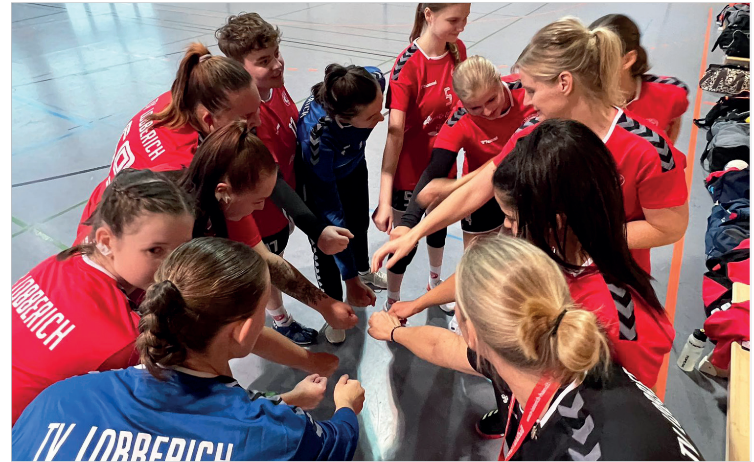
Starker Teamgeist bei der 3. Damenmannschaft des TV Lobberich