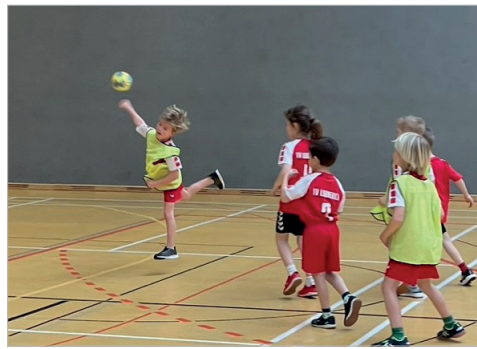
Die Minis in Aktion....