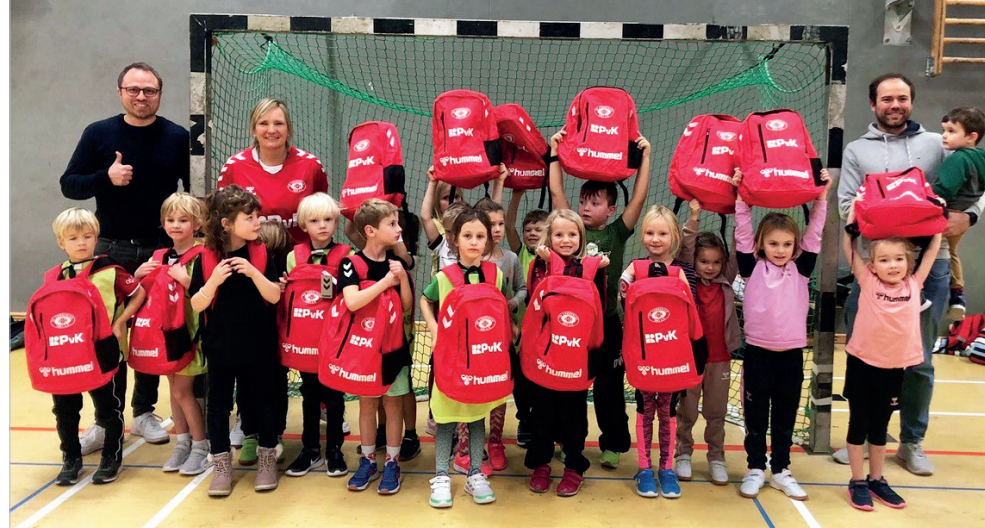
Neu ausgestattet mit Trikots und Rucksäcken. Herzlichen Dank an die Firmat PvK aus Nettetal-Lobberich.