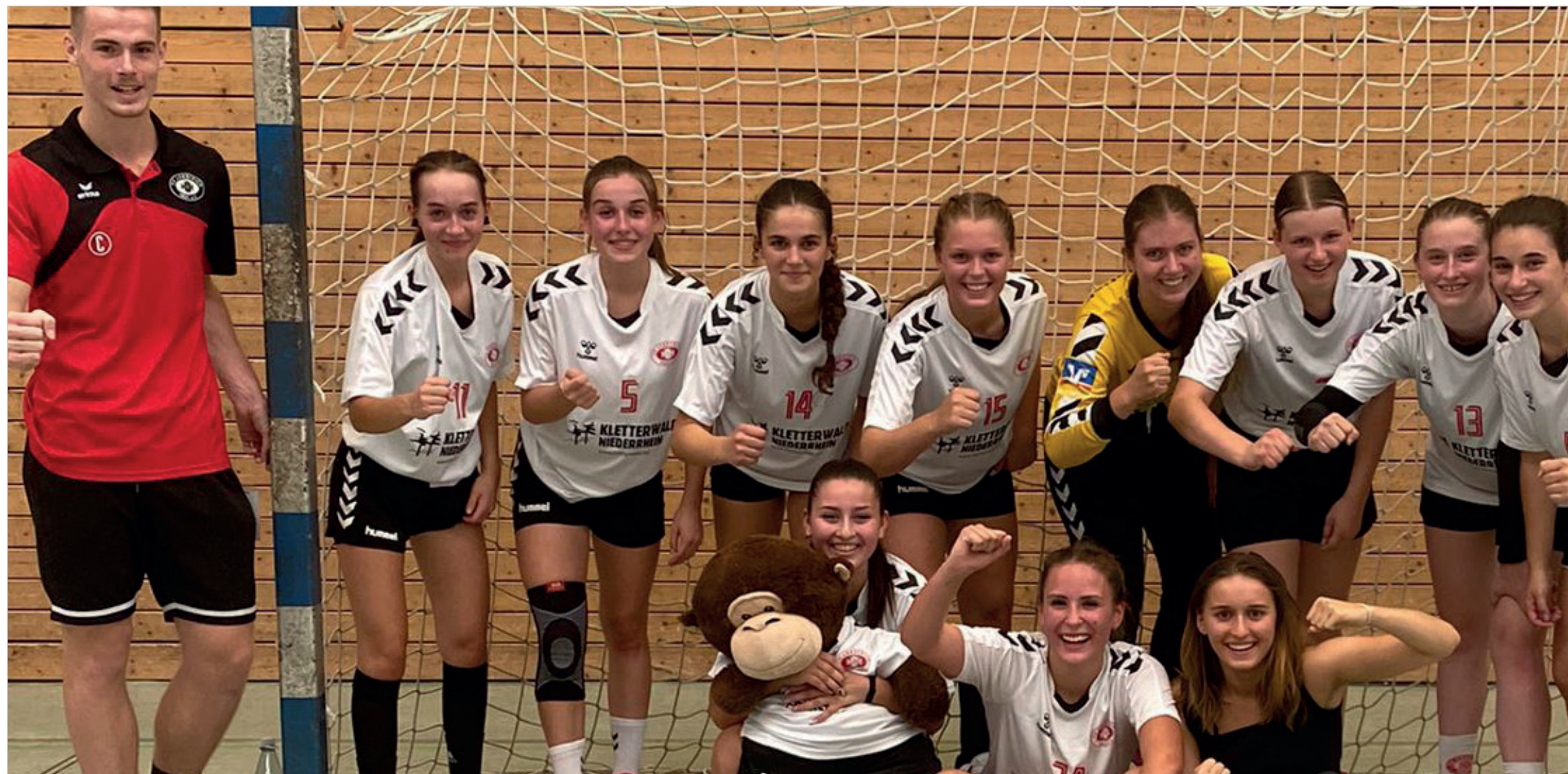
Freudige Gesichter bei der weiblichen A-Jugend beim Sieg in Korschbroich