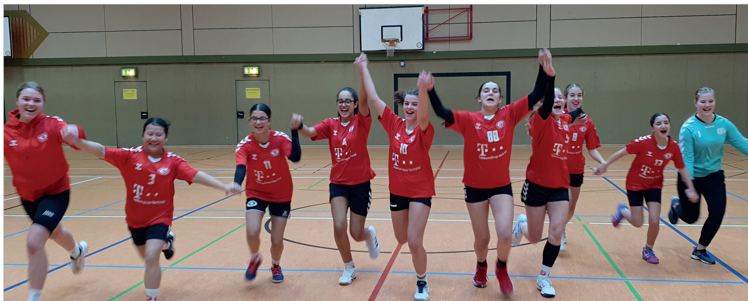
Freude bei der weibl. C-Jugend. Sie belegen aktuell den 3. Tabellenplatz!