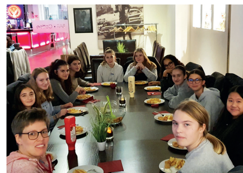
Mannschaftssitzung der weibl. C-Jugend