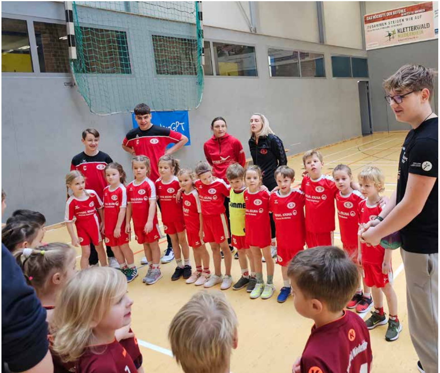
Die Kleinsten bei der Begrüßung der gegnerischen Mannschaft aus Niederkrüchten

der Abwehrarbeit – und gleichzeitig das Miteinander und der Teamgeist wuchsen. Das Engagement war über die gesamte Saison hinweg ungebrochen. Beim Training und in jedem Turnier spürte man die Spielfreude und oft war diese größer als jeder Ehrgeiz auf Ergebnisse.