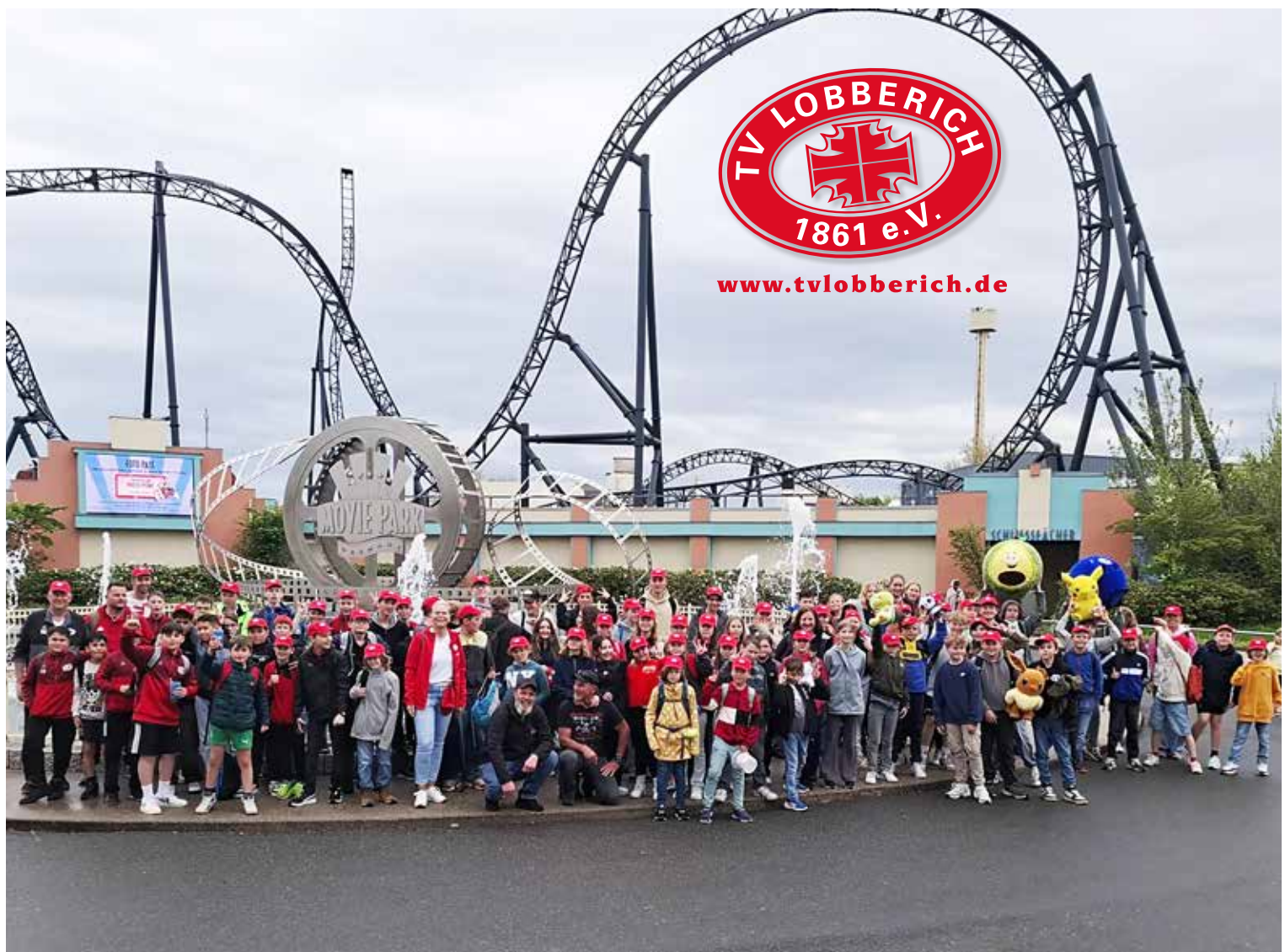
90 Kinder waren beim Besuch des Movie Parks dabei und 10 Betreuerinnen und Betreuer

Am späten Nachmittag traten alle gemeinsam die Rückfahrt an. Müde, aber glücklich und voller neuer Eindrücke kamen die Kinder am Abend wieder in Lobberich an. Der Ausflug war für alle Beteiligten ein voller Erfolg und wird sicher noch lange in schöner Erinnerung bleiben.