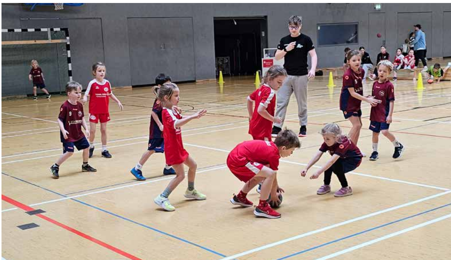
Spielszene bei den Minis