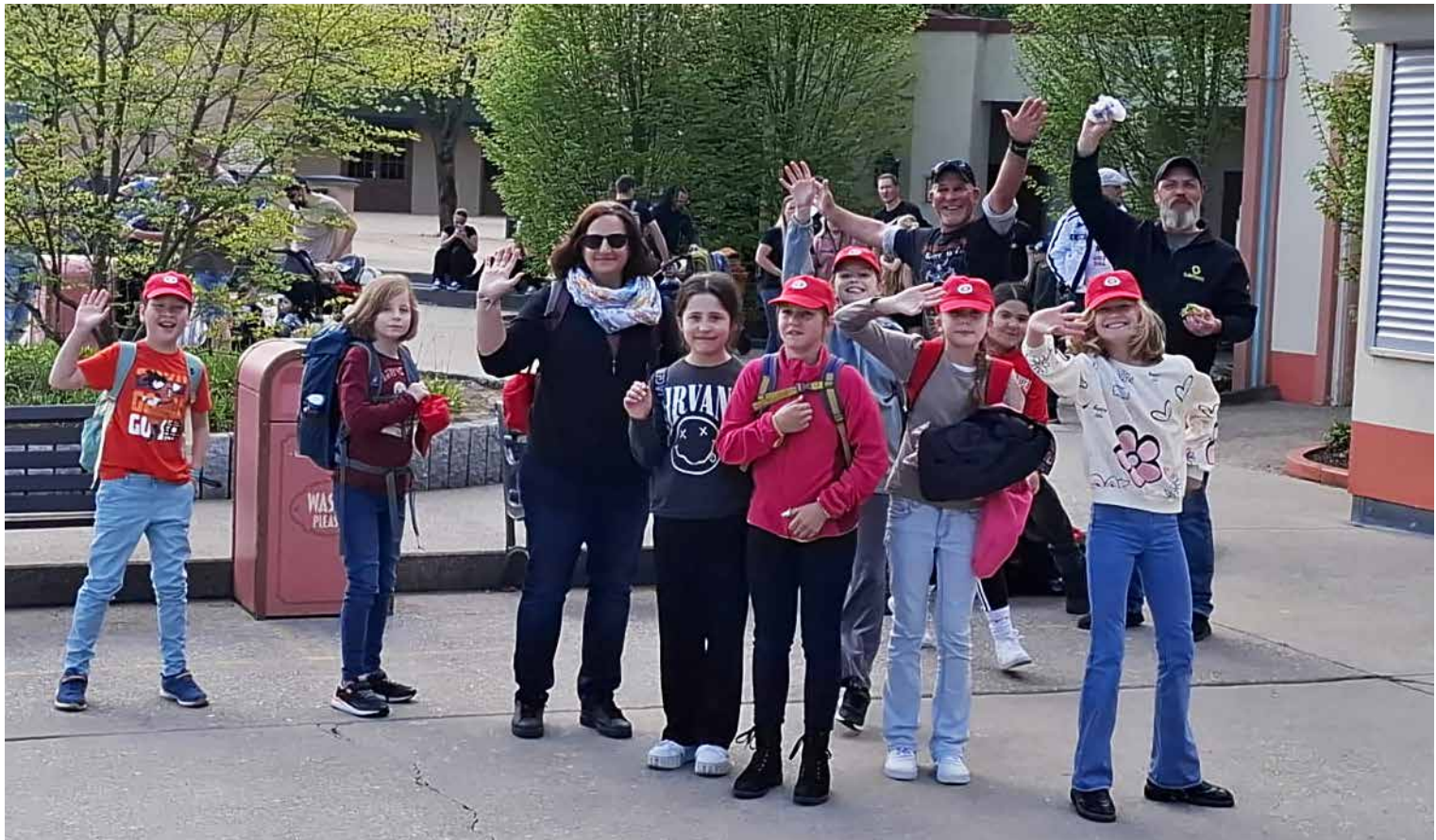
Ausgelassene Kinder und Betreuer