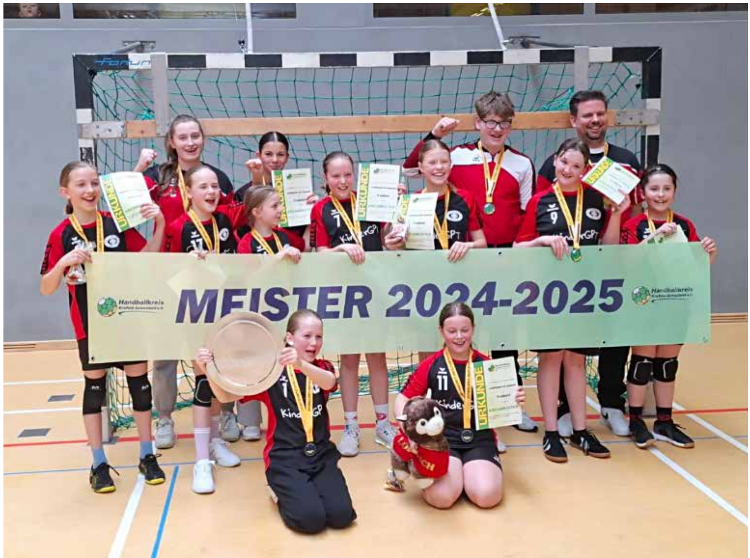
Große Freude bei allen Spielerinnen und Trainern über den Kreismeistertitel 2024 / 2025!

Abschließend möchten wir uns als weibliche E-Jugend einmal bei allen, die uns in der letzten Saison unterstützt haben, bedanken. Besonderer Dank gilt auch den Eltern, die sowohl ihre Kinder als auch uns Trainer immer unterstützt haben! Ohne euch wäre das nicht möglich gewesen!!