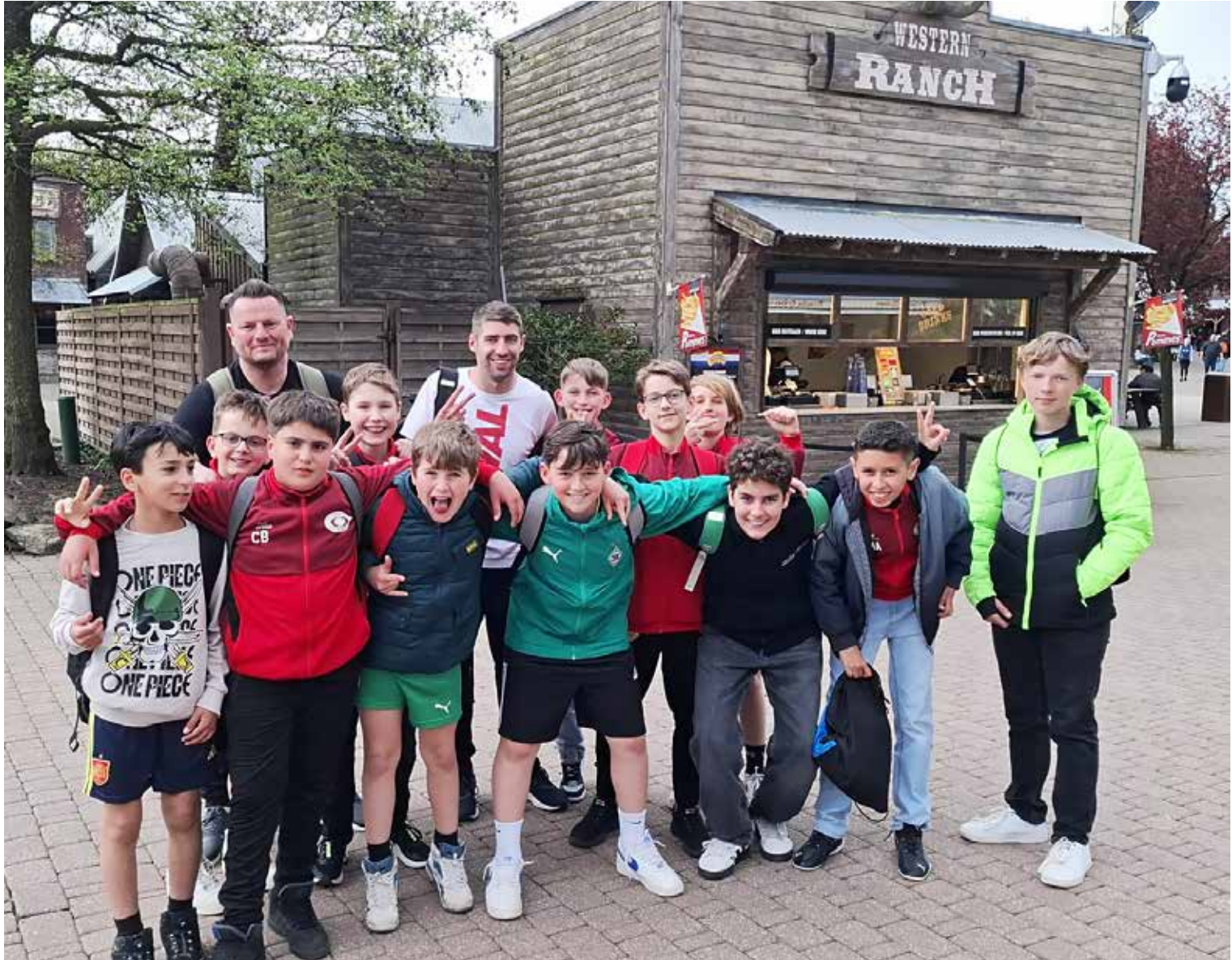
Wilde Jungs im Wilden Westen!