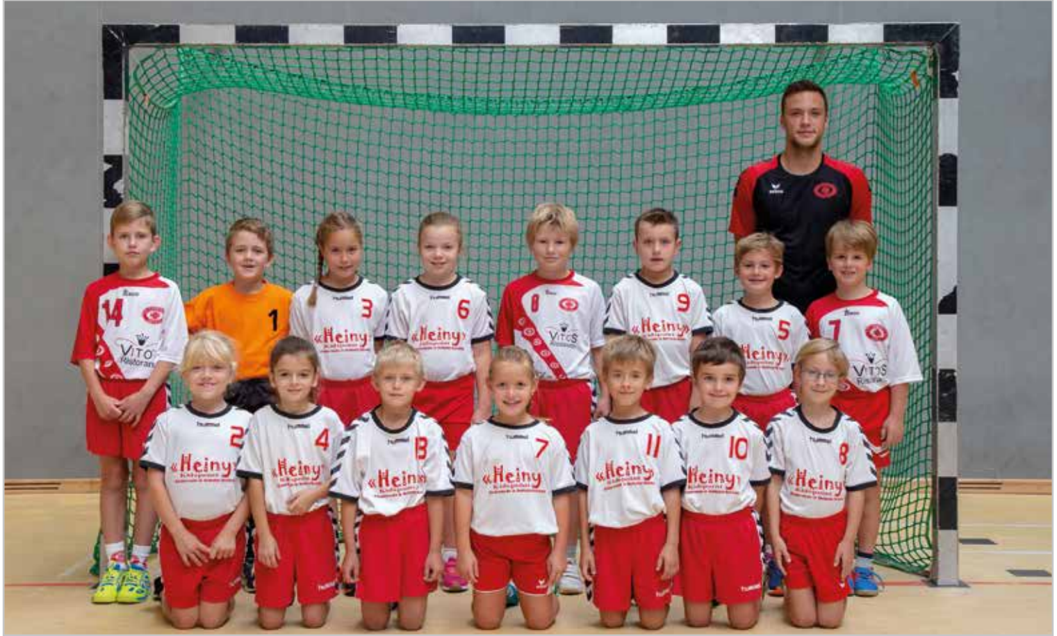
Die gemischte F-Jugend des TV Lobberich 1861 e. V.