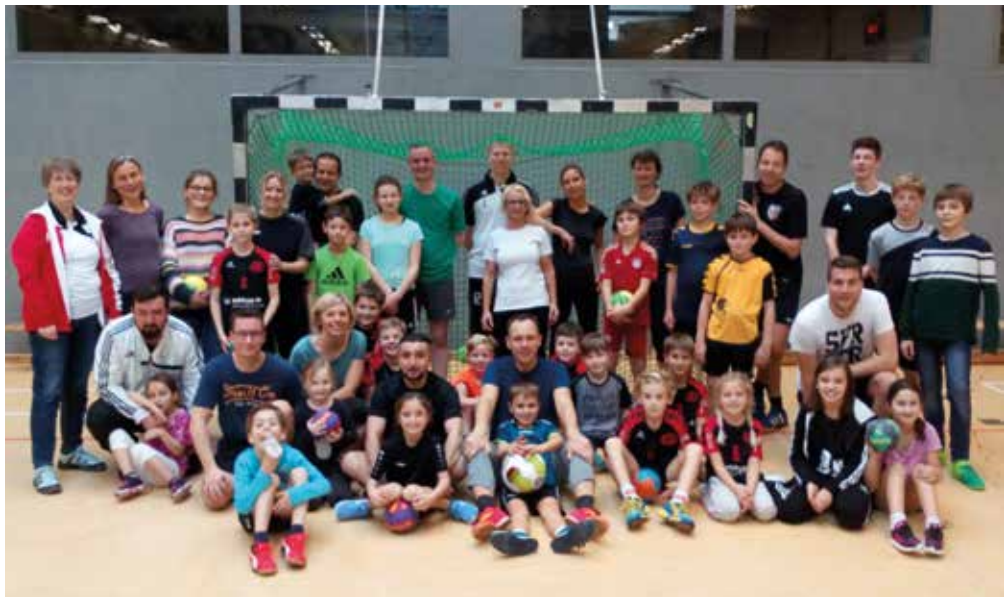
Gruppenfoto bei der Weihnachtsfeier